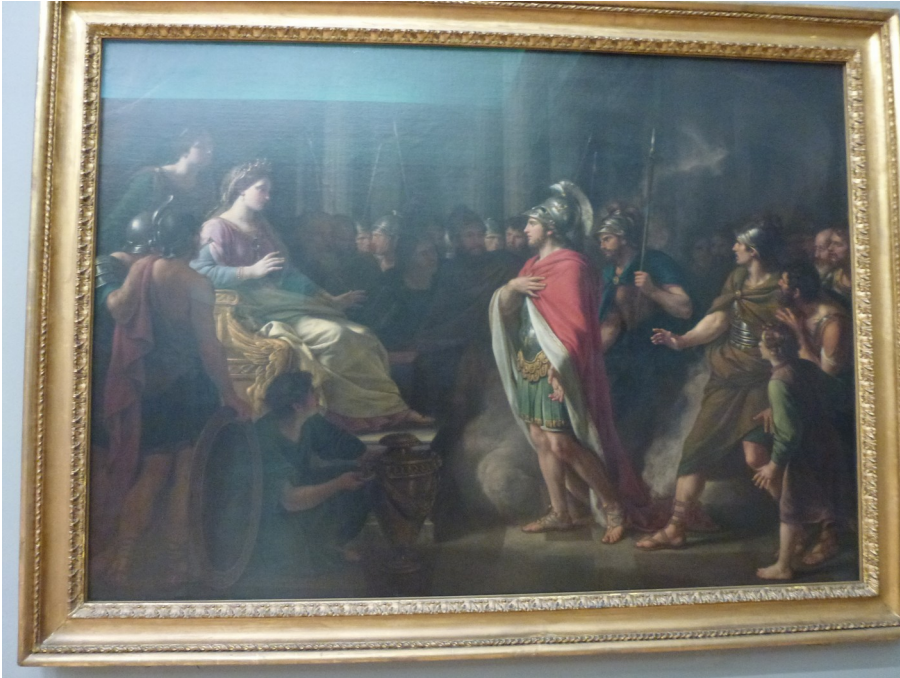
Nathaniel Dance-Holland, The Meeting of Dido and Aeneas (1766). Exposé à la Tate Britain Gallery, Londres.

S'il s'agit de la photographie d'une œuvre d'art (réalisée légalement), il convient alors de citer le nom de l'artiste de l'œuvre originale, le titre de l'œuvre, la date de création et le lieu où est exposée l'œuvre.