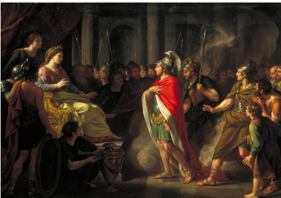
Nathaniel Dance-Holland, The Meeting of Dido and Aeneas (1766).

Si l'image est protégée par la licence Creative Commons 1 (comme les images que l'on trouve sur le site de Wikipedia, par exemple), elle est réutilisable gratuitement, mais sous certaines conditions. La première de ces conditions, est l'obligation de citer le nom de l'auteur de l'œuvre originale (paternité de l'œuvre).